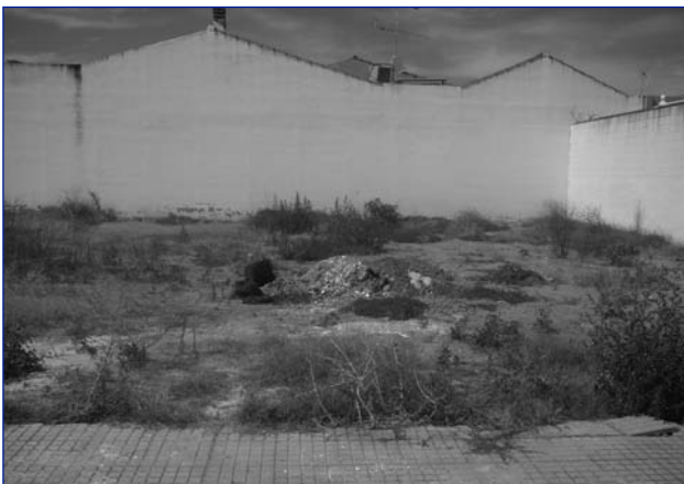
Los solares siguen sin vallarse y sirven para amontonar basuras y criar toda clase de bichos.