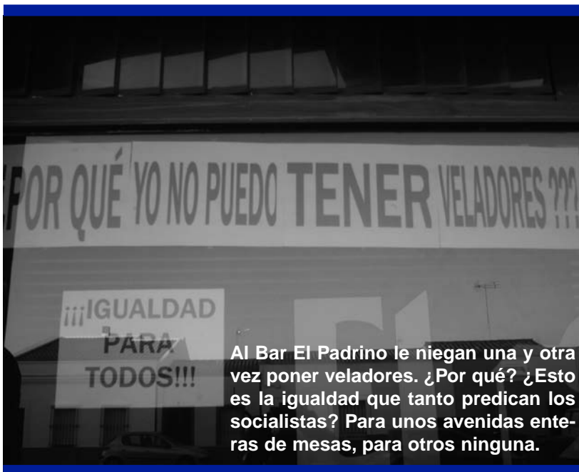
Al Bar El Padrino le niegan una y otra vez poner veladores. ¿Por qué? ¿Esto es la igualdad que tanto predicán los socialistas? Para unos avenidas enteras de mesas, para otros ninguna.

artistas también han hecho sus galas en la Casa de la Cultura de Puebla en alguna ocasión este año pasado. Por supuesto que en ningún momento nos oponemos a la actuación de estos artistas, todo lo contrario, nada en absoluto tenemos contra ellos, ojalá hubiera aún más artistas en el Pueblo que pudieran actuar con la misma profesionalidad que estos lo hacen. Lo que si reclamamos es que se le de el mismo trato a otra gente del Pueblo, que también han demostrado estar capacitados en otros tiempos para hacerlo, aunque parece que ahora ya no, al no coincidir con la ideología del Grupo de Gobierno. ¿Esto tampoco es discriminación verdad?