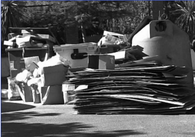
Los contenedores que se ponen en los pueblos, son para recoger basuras, no para almacenarlas.

En el último boletín informativo del Ayuntamiento (más bien boletín de propaganda del PSOE), aparecían unas fotografías de obras nuevas y cositas bonitas de nuestro pueblo, como si esto fuera la panacea, pero como en el monte no todo es orégano, acompañamos nosotros unas fotos en este boletín, de lo que también es nuestro pueblo.