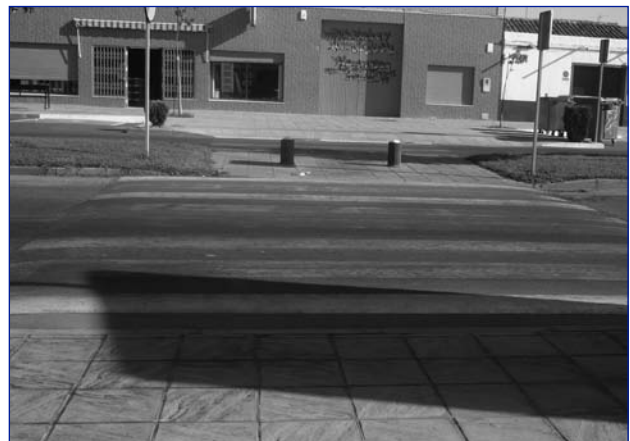
Los pasos de peatones de la Calzada Romana, que ya han sido escenario de accidentes, están sin pintar.