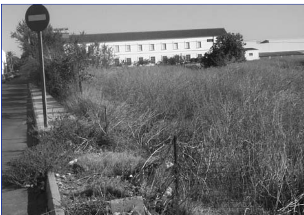
Bonita perspectiva de la Calle Don Bosco