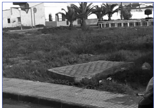
Solar con cama incluida

Tus quejas, consultas o sugerencias: pp.pueblacalzada@gmail.com